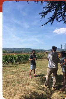
A l'initiative du projet, ils sont parties prenantes de la démarche et seront les garants de la mise en oeuvre du programme d'actions.

Ils réalisent le diagnostic paysager, identifient les objectifs de qualité paysagère et proposent le programme d'actions.