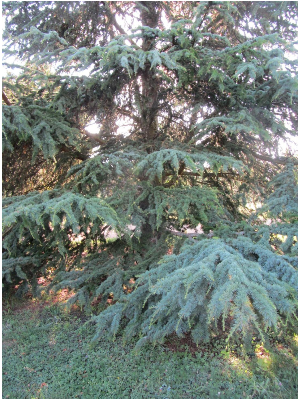
Parcs visites